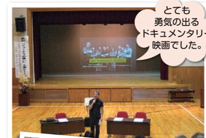
とても勇気のあるドキュメンタリー映画でした。