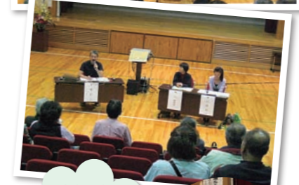
わきあいあいトークは楽しかったです。