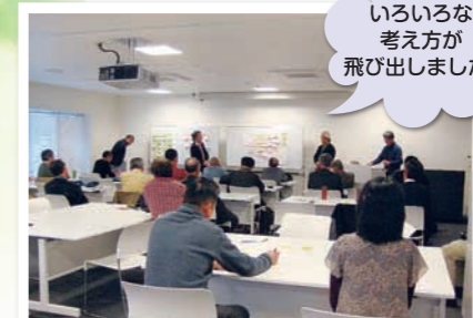
いろいろな考え方が飛び出しました。

日時:2012年4月15日(日)13:30~16:30 場所:えんば一く(塩尻市市民交流センター) 内容:自然エネルギーネットまつもとで取り組みたいこと、松本地域で実現したいことなどの話し合いをしました。