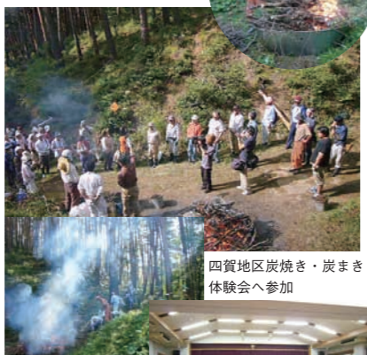
四賀地区炭焼き・炭まき体験会へ参加

多くの森林に囲まれた松本地域ですが、現在のところ森林資源として有効に活用しているとは言えないと思います。「この恵まれた森林資源を有効に活用して、循環型の社会を築いていきたい」という思いから集まったメンバーは、木曾、安曇野、松本、筑南、筑北と様々で、それぞれ地域に根ざした特色のある活動や考えを持った方々です。当面は、薪や炭といった身近な木質バイオマスの利用について、月1回くらいのペースで勉強をしていきたいと思っています。